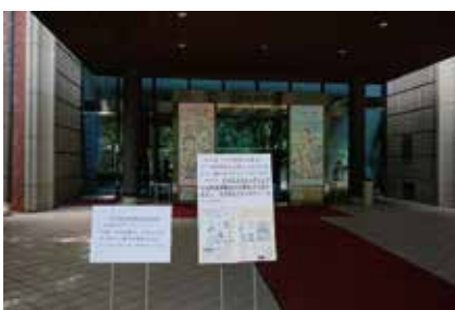
▲呉市立美術館入口

会期：2018年7月22日(日)～9月9日(日) 開館時間：10～17時(入館16時30分まで) 休館日：火曜(火曜が祝日・振替休日の場合はその翌日) 観覧料：一般300円、高校生180円、小中学生120円