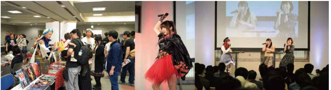
▲安芸コミの様子(左)(主催者提供)、「ひろしまアニソン王」参加者熱唱の様子(中央)(主催者提供)、今井麻美さんトークショー(右)(主催者提供)

今年は中国、香港、インドネシア、日本、韓国、フィリピン、ロシア、シンガポール、台湾、タイ、アメリカ、ベトナムなど12以上の国・地域からコスプレヤーが参加し、ステージでのトークやパフォーマンス、一般参加者との交流に加え、おりづるタワーの見学も行いました。