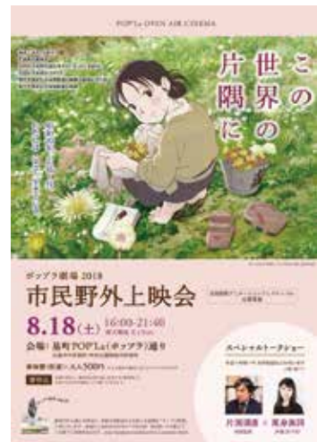
▲ポップラ劇場 2018 チラシ

★ついに長尺版の情報解禁！『この世界の(さらにいくつもの)片隅に』2018年12月公開予定！ http://ikutsumono-katasumini.jp/