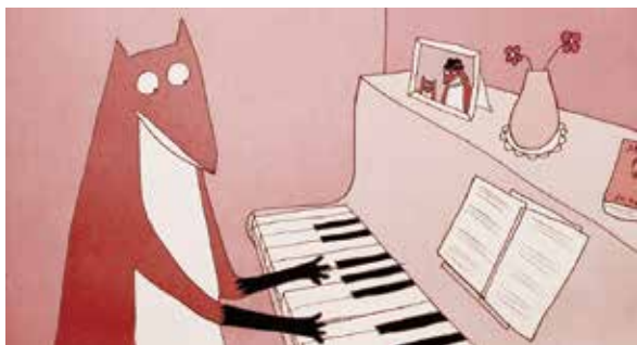
"Manivald" 『マニヴァルド』 監督：Chintis Lundgren(チンティス ルンドウグラン) ©National Film Board of Canada