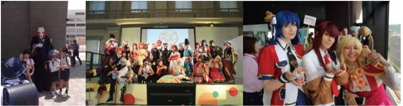
▲コスプレヤーの交流の様子(左・中央)(主催者提供)、おりづるタワー見学の様子(右)(主催者提供)

ポップカルチャーを通じ、国境を越えた若者達の交流をめざすイベント「ポップカルチャーひろしま 2018」が昨年に続いて今年も開催されました。6月16日(土)・17日(日)に旧日本銀行広島支店や合人社ウエンディひと・まちプラザ、頼山陽史跡資料館(庭園)の会場に、2日間で5,402人の参加者が交流を楽しみました。