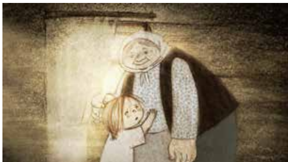
"Sombryuk" 『オオカミ』 監督：Polina Fyodorova(ポリーナ フョードロワ)